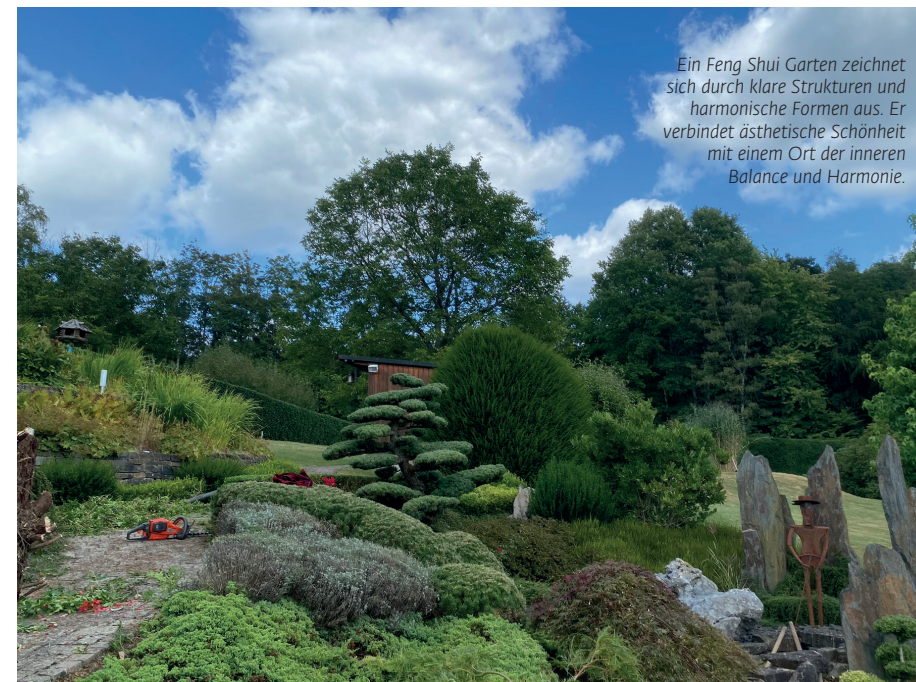
Ein Feng Shui Garten zeichnet sich durch klare Strukturen und harmonische Formen aus. Er verbindet ästhetische Schönheit mit einem Ort der inneren Balance und Harmonie.